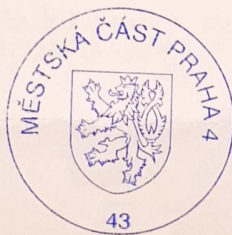
Ing. Hana Rusňáková vedoucí oddělení vodoprávního a územního rozhodování

Proti tomuto rozhodnutí se lze dle ust. § 81 odst. 1 ve spojení s ust. § 83 odst. 1 zákona č. 500/2004 Sb., správní řád, ve znění pozdějších předpisů odvolat ve lhůtě 15 dnů ode dne jeho oznámení k odboru ochrany prostředí Magistrátu hl. m. Prahy, se sídlem Jungmannova 35/29, Praha 1, podáním učiněným u zdejšího správního orgánu tzn. odboru stavebního Úřadu městské části Praha 4, se sídlem Antala Staška 2059/80b, 140 46 Praha 4. Odvolání se podává s potřebným počtem stejnopisů tak, aby jeden stejnopis zůstal správnímu orgánu a aby každý účastník dostal jeden stejnopis. Nepodá-li účastník potřebný počet stejnopisů, vyhotoví je správní orgán na náklady účastníka. Odvoláním lze napadnout výrokovou část rozhodnutí, jednotlivý výrok nebo jeho vedlejší ustanovení. Odvolání jen proti odůvodnění rozhodnutí je nepřipustné.